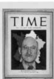
ROBERT SCHUMAN Born in Luxembourg, he was France's Foreign Minister when the European Coal and Steel Community was launched as the first step in his plan for European integration.

Hugh Thomas, a member of Britain's House of Lords, has written books on the Spanish Civil War, Cuba and the conquest of Mexico. His most recent book is The Slave Trade.