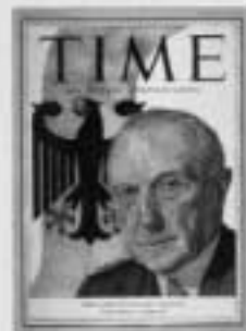
KONRAD ADENAUER Imprisoned by the Nazis during World War II, he went on to lead the Christian Democratic Union and become the first Chancellor of the new Federal Republic.