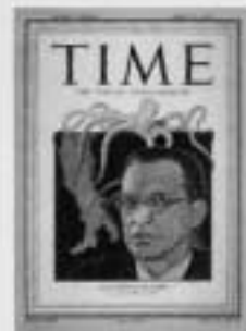
ALCIDE DE GASPERI A former journalist, Vatican librarian and resistance fighter, he helped found the Christian Democratic Party and was Prime Minister during Italy's post-War reconstruction.