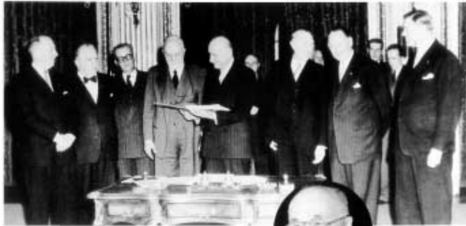
Signature, le 18 avril 1951, du traité instituant la Communauté européenne du charbon et de l'acier. Six pays mettent alors en œuvre une forme de coopération internationale entièrement nouvelle, qui doit assurer paix et prospérité aux États membres de la première Communauté.