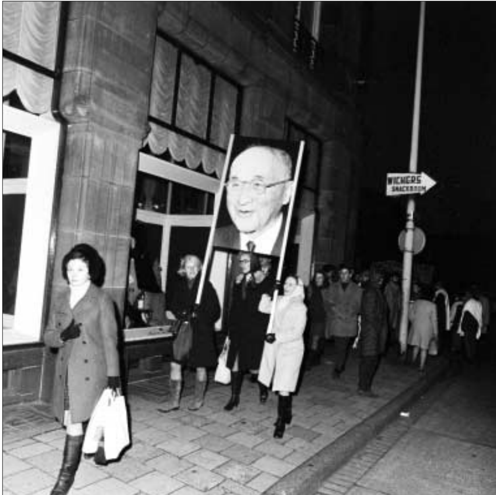
L'EFFIGIE DU PÈRE DE L'EUROPE dans une manifestation en marge du Sommet de La Haye le 1 er décembre 1969.