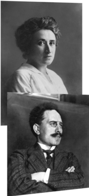
561 N° 43

Quoiqu'invariablement situés du même côté de la barricade anti-impérialiste, anti-opportuniste et anti-révisionniste, Lénine et Rosa se sont en effet confrontés durement, quoique fraternellement, sur plusieurs questions stratégiques. Que ce soit sur la question nationale, où Lénine reprochait à la Polonoise Rosa de sous-