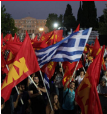
manifestation massive du KKE place syntagma - 16/09/15

Mais à quelque chose malheur est bon : le roi Euro et ses courtisans, les dirigeants de l'Internationale "socialiste", du Parti de la Gauche Européenne et de la Confédération Européenne des Syndicats, bref, tous ceux qui ont chanté les louanges de l' "Europe sociale, pacifique et démocratique", sont NUS et de plus en plus de gens s'en aperçoivent. L'analyse que le PRCF faisait, presque seul en 2004, à savoir que